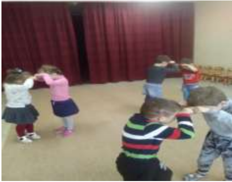
Музыкальная игра «Рожки и копытца».