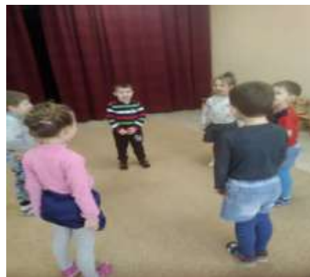
Осенний спектакль «Почему помидор стал красным» Театральная игра «Жил был язычок»