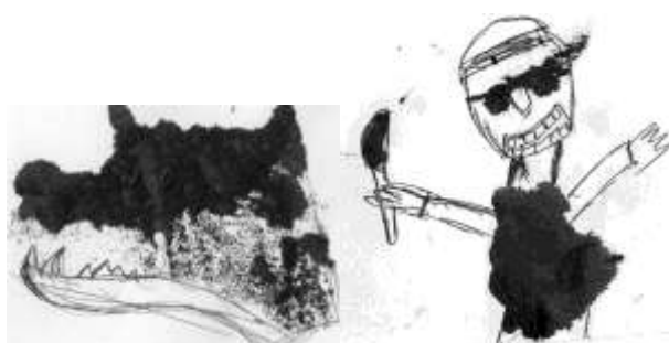
Кляксы в начале занятий