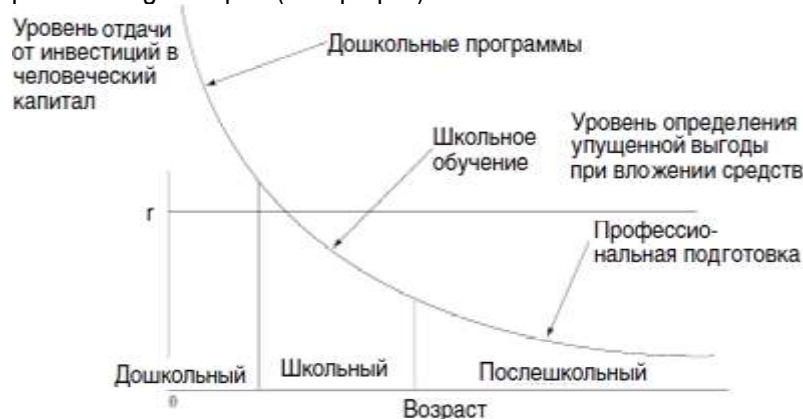
Рис. Показатели окупаемости инвестиций в человеческий капитал в области образования

В современных системах образования большинства развитых стран раннему образованию в последнее время придается все большее значение. Осознание важности системного образования детей, начиная с самого раннего возраста (от нескольких месяцев) до 7–8 лет (обычно это возраст поступления детей в школу), базируется на результатах многочисленных исследований и на практике некоторых стран. В частности, об этом свидетельствуют чрезвычайно популярные в последнее время данные, полученные в исследовании эффективности международной образовательной программы «High/Scope» (см. график).