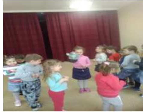
Музыкальная игра «Кот и мыши».