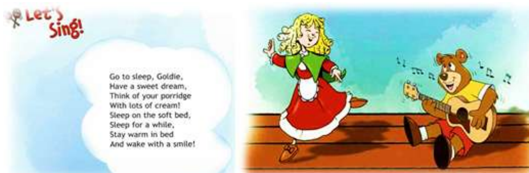
Рисунок 3. Песня к сказке «Goldilocks and the Three bears» («Spotlight-4» Н.И. Быковой, Дж. Дули и др. (М.: Express Publishing: Просвещение))

Помимо языковых и речевых компетенций важно дать учащимся наглядное представление о жизни, традициях, языковых реалиях англоговорящих стран. Если при этом у младших школьников включается ассоциативный ряд и работа построена на сопоставлении английской и русской народных сказок, то процесс социализации средствами английского языка запускается и на «родном» уровне. К примеру, учащиеся 4 класса погружаются в страноведческий компонент через музыкальный (Рисунок 3).