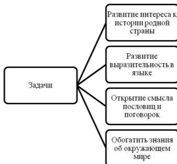
Рисунок 1 - Воспитательные задачи, решаемые при использовании народного творчества

На рисунке 1 представлены воспитательные задачи, решаемые при использовании народного творчества в воспитательной работе: